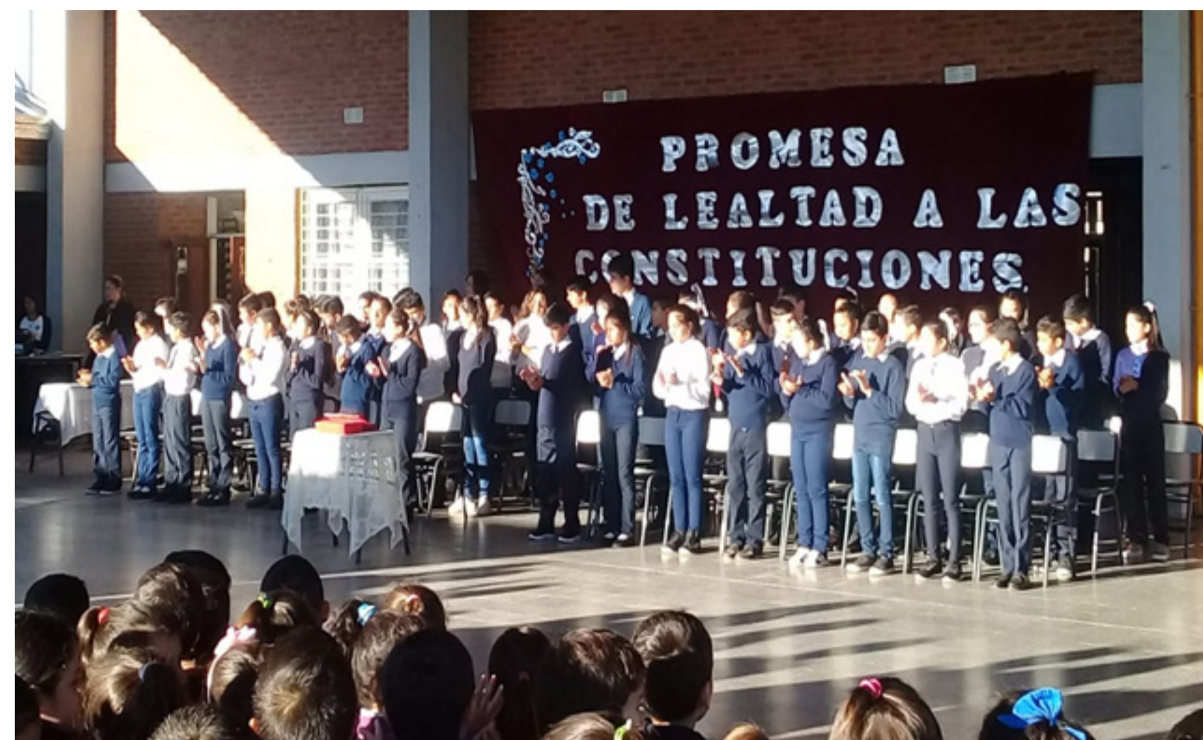
Los alumnos de 7° recitando el Preámbulo de la Constitución Nacional.

Como docentes nos sentimos muy orgullosos de la madurez demostrada por estos niños en todo el trabajo previo a esta fiesta de la democracia y mantenemos la esperanza de que serán constructores de un país justo, libre y respetuoso de sus leyes.