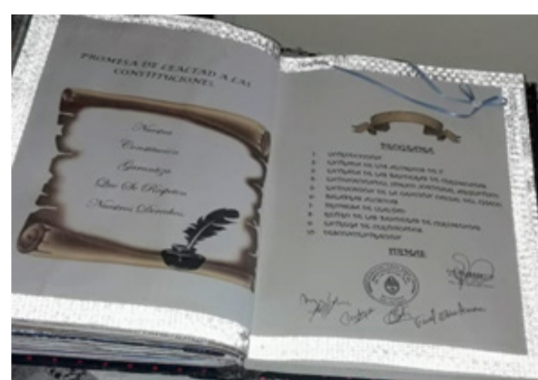
Libro de firmas Acto Día de las Constituciones nacional y Provincial.