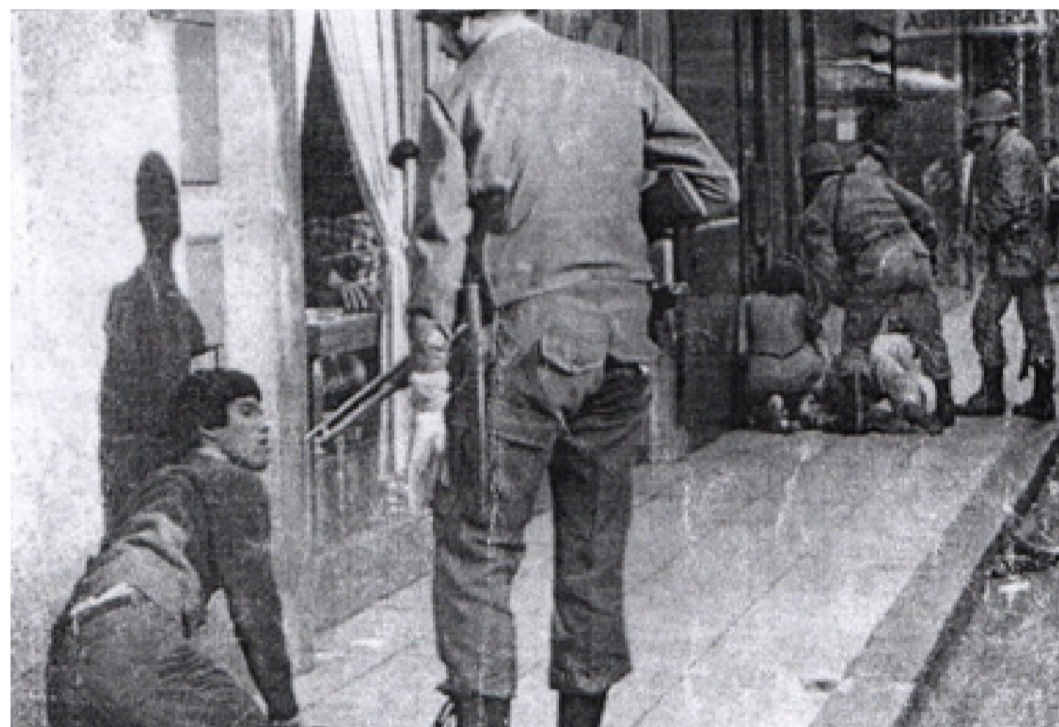
Militares en el momento de detención.

Todos los 24 de marzo en nuestro país se recuerda una de las épocas más trágicas de las que se tiene memoria.