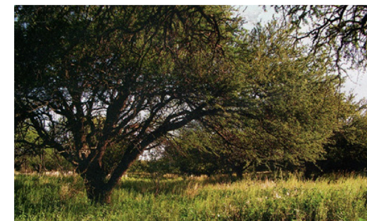
Bosques de llanuras del centro y del sur.

La UE promueve la protección del medio ambiental mediante acuerdos con otros países. Estos acuerdos cubren aspecto tales como la biodiversidad global, el comercio de fauna y flora silvestre, la prohibición del comercio de madera talada ilegalmente y la manipulación segura de productos químicos y los residuos.