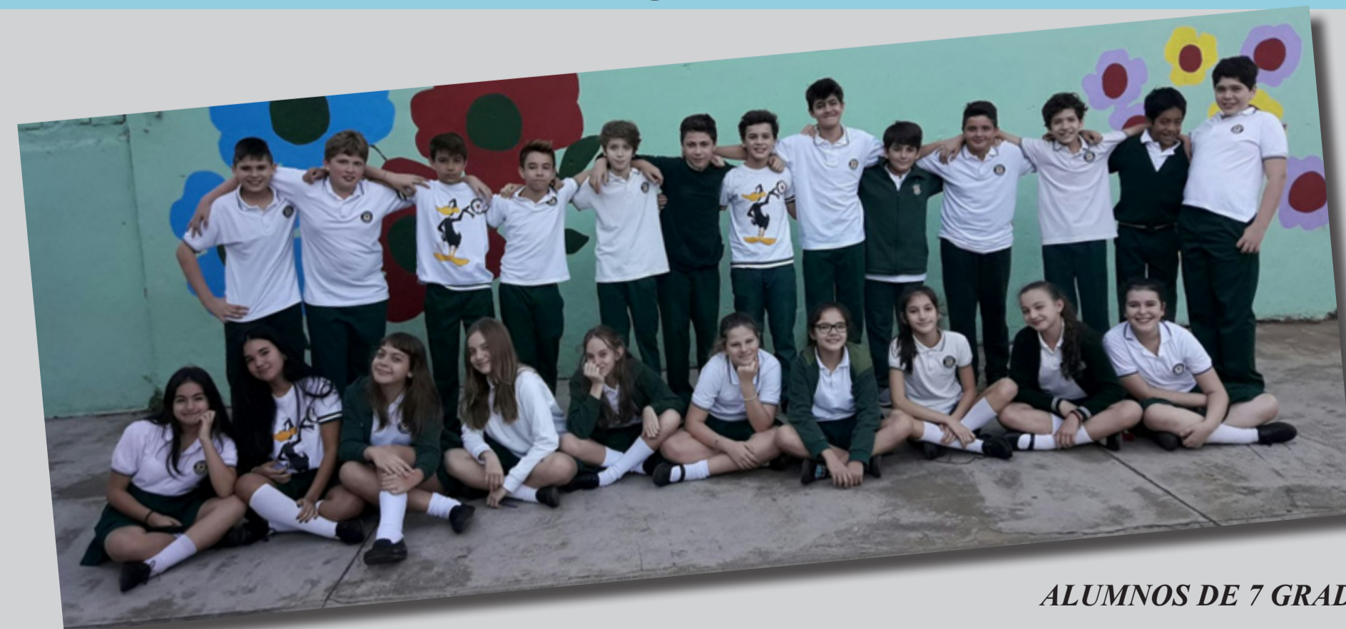
ALUMNOS DE 7 GRADO