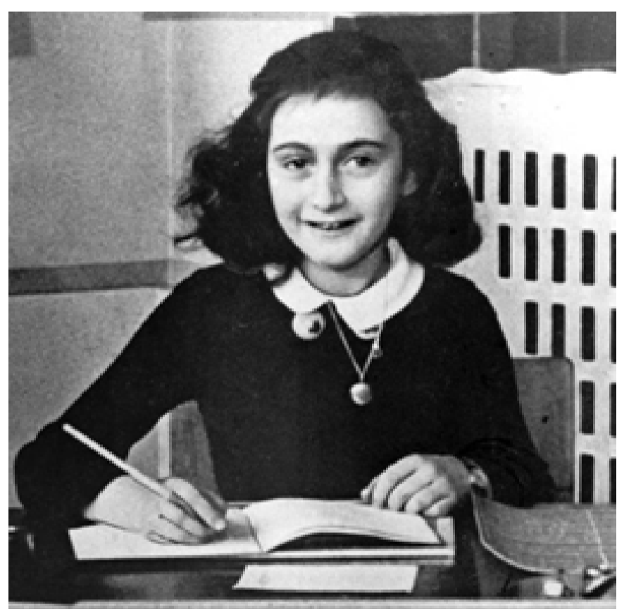
Ana Frank a la edad de 12 años

El diario constituye un conmovedor testimonio de ese tiempo de terror y persecuciones.