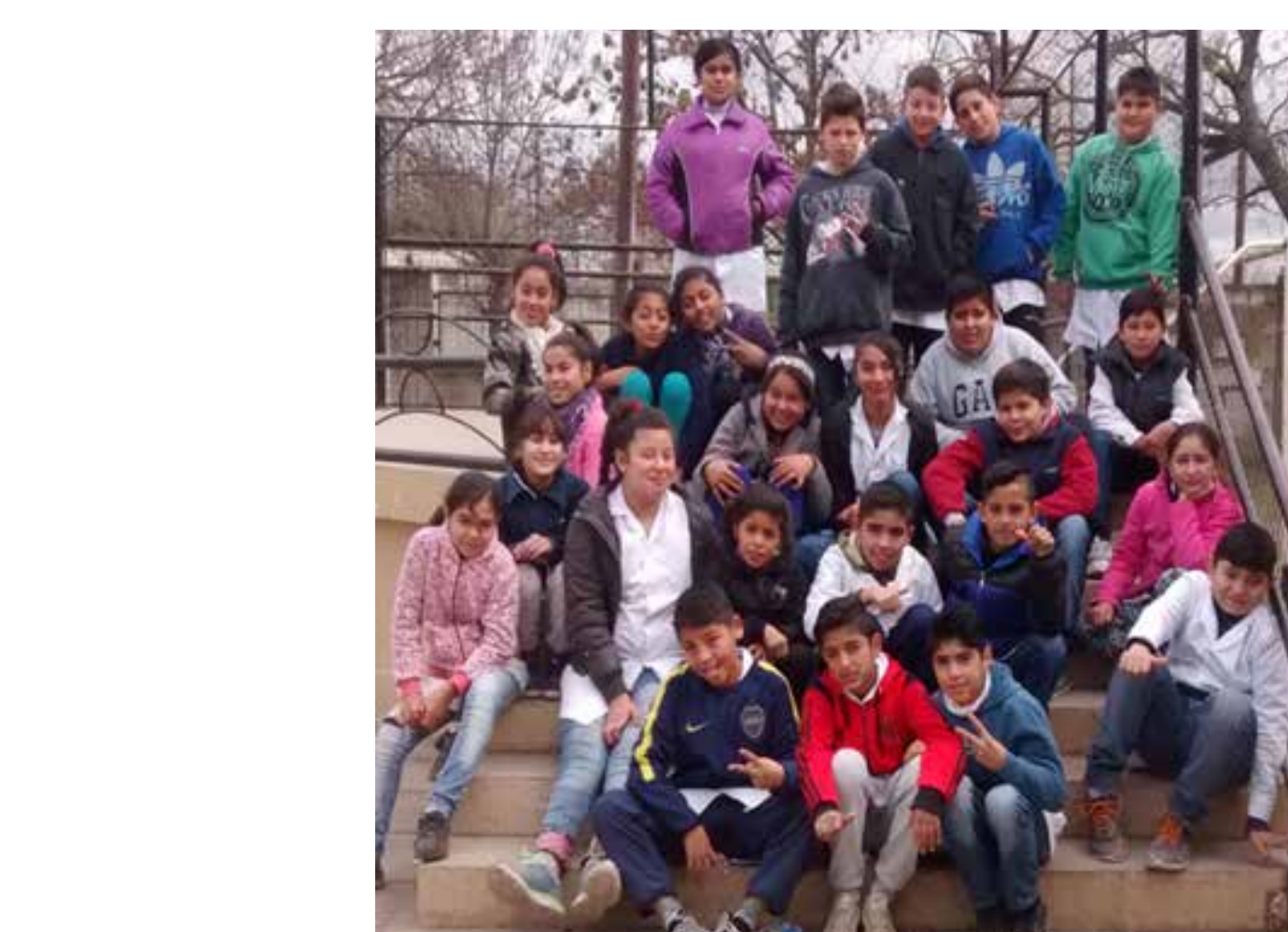
Alumnos de 6° "B" Turno Tarde