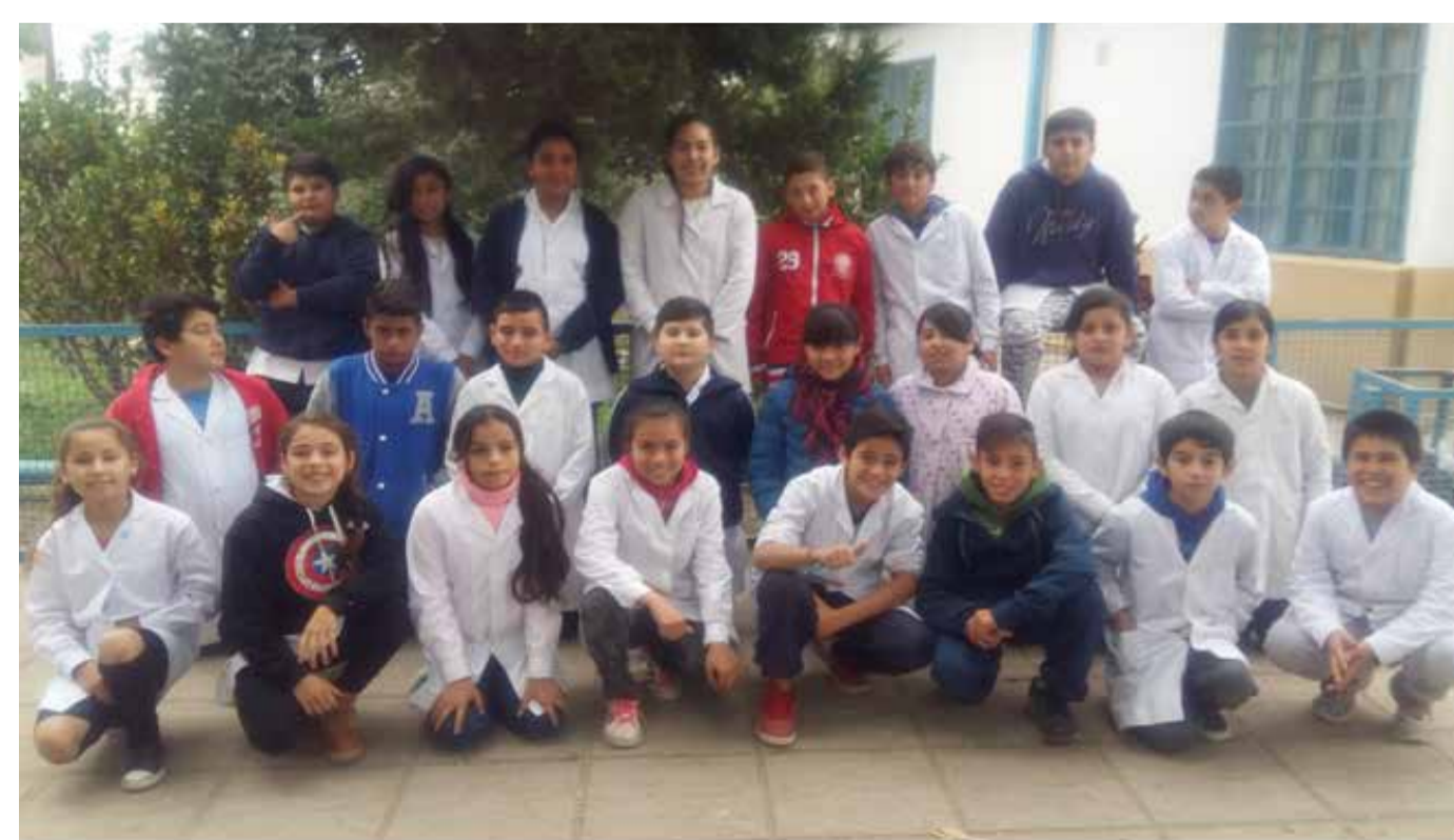
Alumnos de 6° "A" Turno Mañana