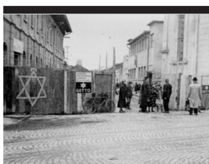
Gueto de Varsovia