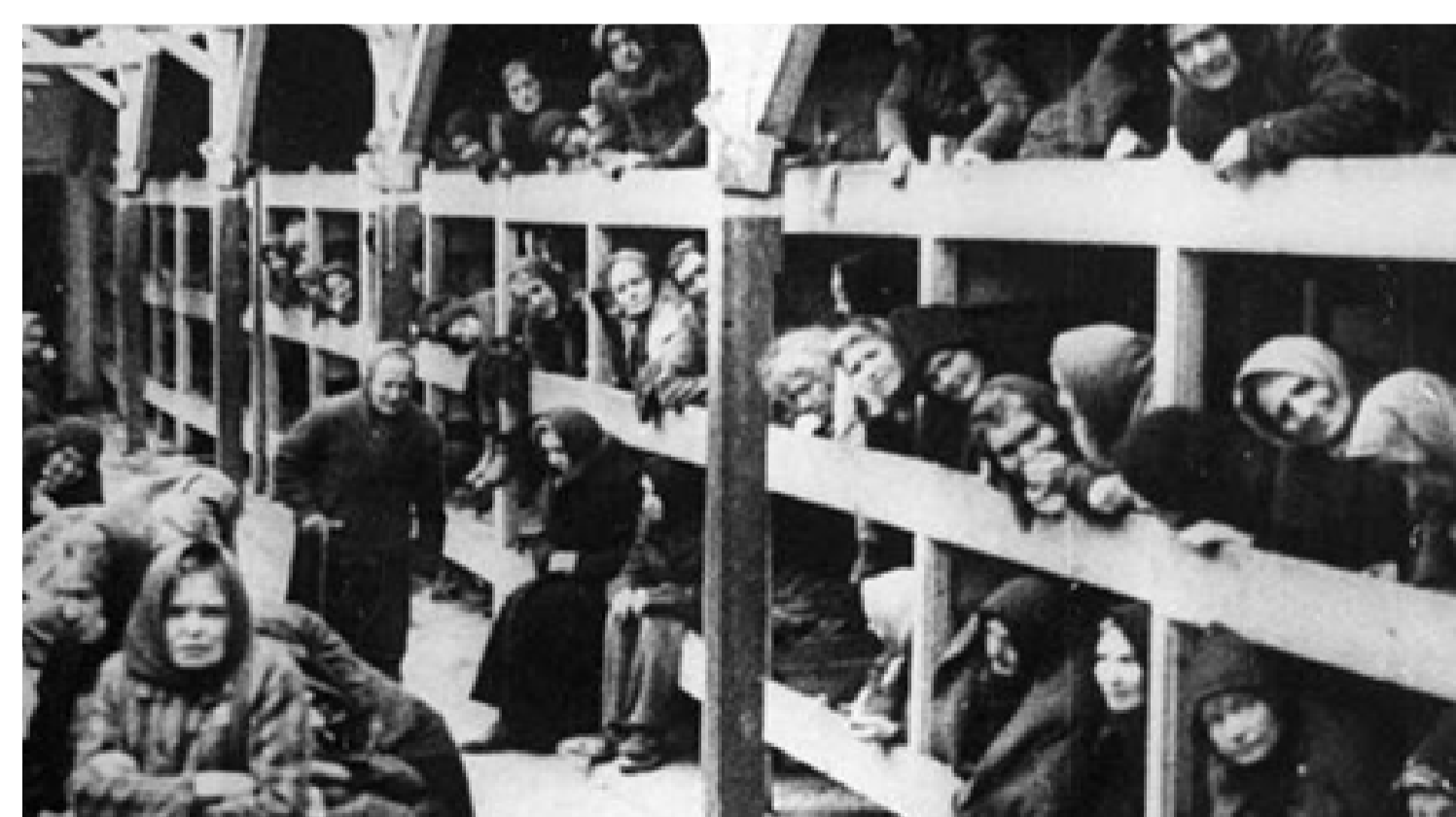
Campo de concentración - exterminio

Los campos de concentración funcionaron principalmente como centros de detención y trabajo y también como lugares para asesinar a grupos más pequeños de personas perseguidas. En 1942 los nazis deciden llevar adelante la "Solución final", la misma estableció instalar los centros de exterminio, estos eran esencialmente "fábricas de la muerte". Las SS y la policía alemana asesinaron a millones de judíos en los centros de exterminio, ya sea por asfixia con gas de guerra o fusilamiento. Algunos de los campos de concentración y exterminio más conocidos son Auschwitz, Sobibor, Treblinka.