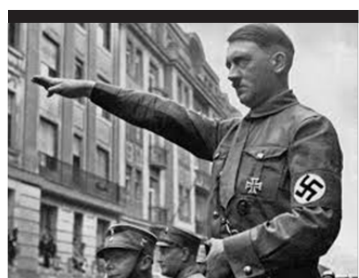
Adolf Hitler, líder del Partido Nacional Socialista.

En primer lugar se empezó a apartar a los judíos, negros, gays, gitanos, personas con discapacidad y a todas aquellas que Hitler no consideraba de sangre pura (raza aria). Antes de los campos de concentración, se dividían a las ciudades en guetos, que eran barrios cerrados por muros que apartaban a los judíos de la sociedad. El gueto más conocido fue el de Varsovia, en Polonia.