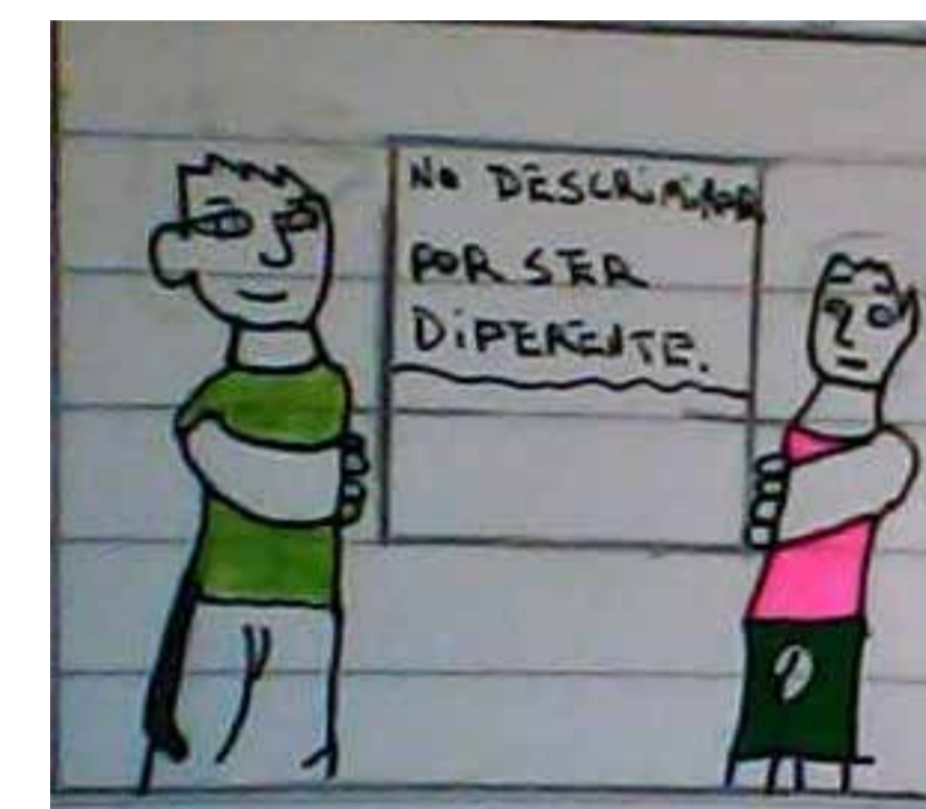
Alumnos de la escuela haciendo campaña de discriminación.

En la escuela municipal Dr. Donato Latella Frías los niños y niñas trabajan sobre la discriminación luego de ver la película de Ana Frank. Ella era una niña que fue discriminada por los nazis por ser judía. Los chicos y chicas de sexto grado luego de ver la película con su maestra empezaron a hacer afiches de campaña sobre la discriminación de todos los días. Luego pasaron al frente en la entrada de los alumnos y alumnas a explicar habían trabajado sobre la discriminación, para tomar conciencia, cambiar la actitud con todos los compañeros y compañeras.