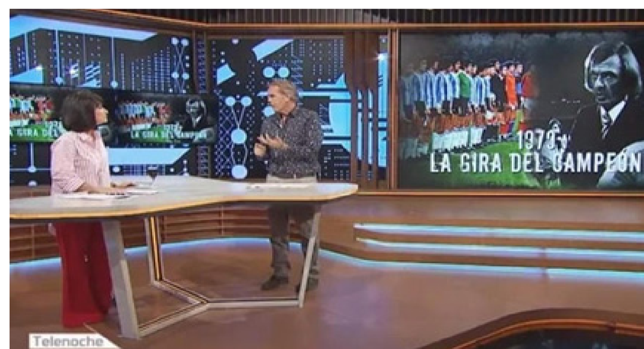
En esta foto se pueden ver a los periodistas en el programa.

En el programa de TN, "Bonadeo es mundial: la revancha de Argentina-Holanda en 1979". Los periodistas Gonzalo Bonadeo y María Laura Santillán presentan un documental en el cual se revelan datos y sucesos desconocidos por la sociedad acerca del mundial y sus consecuencias.