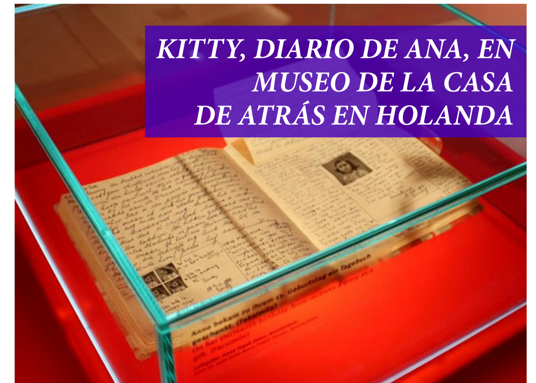
KITTY, DIARIO DE ANA, EN MUSEO DE LA CASA DE ATRÁS EN HOLANDA

Al desplomarse la bolsa de valores de Nueva York en octubre de 1929 se desató una crisis económica que afectó a casi todo el mundo ya que EEUU eran el gran prestamista de Europa, fue conocido como El Crack De Wall Street. Una muy veloz caída de los precios de las acciones de las empresas.