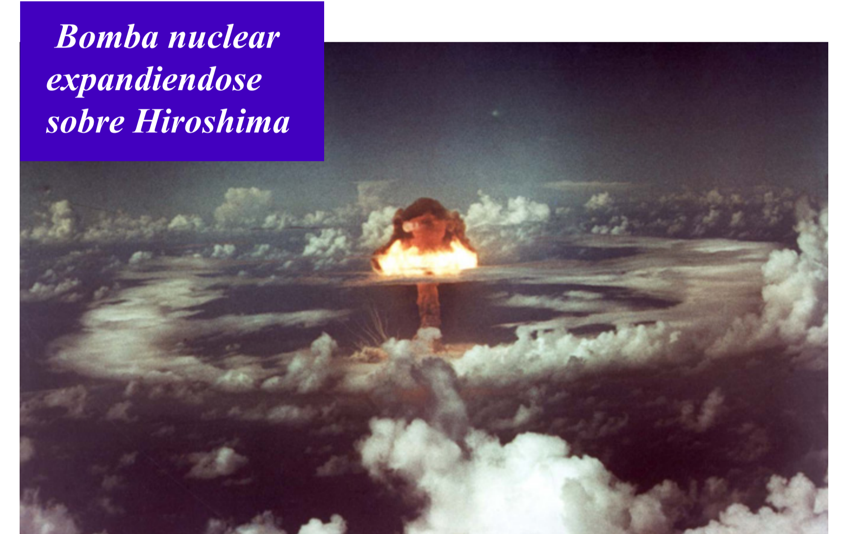
Bomba nuclear expandiéndose sobre Hiroshima

El poderoso ejército alemán empieza a expandirse ocupando gran parte de Europa, incluida Francia. Mientras tanto, Japón hacia lo propio en regiones de China. Parecía que las potencias del eje ganarían la guerra. Pero en 1941 Alemania invadió la Unión Soviética y los japoneses atacaron Per Harbor (islas de EEUU). Tanto la URSS como EEUU pasaron entonces a formar parte de los aliados. En 1942 Moscú resistió el avance alemán y obligó a las tropas alemanas a pasar el frío invierno en campo enemigo. Durante 1943 y 1944 la balanza se inclinó a favor de los aliados. La guerra en Europa terminó en 1945, cuando los rusos llegaron a Berlín y Adolf Hitler se quita la vida llevándose mucho con él.