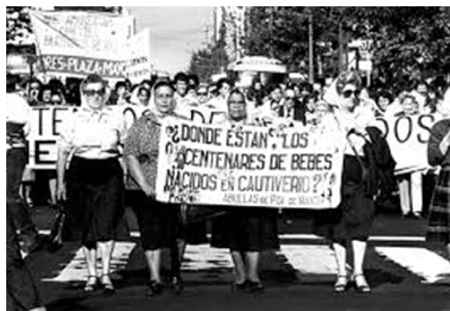
Abuelas de Plaza de Mayo

Las chicas y los chicos de 7° “B” de la escuela N° 14 “Leopoldo Lugones” investigaron sobre lo ocurrido en nuestro país durante la última dictadura cívico militar.