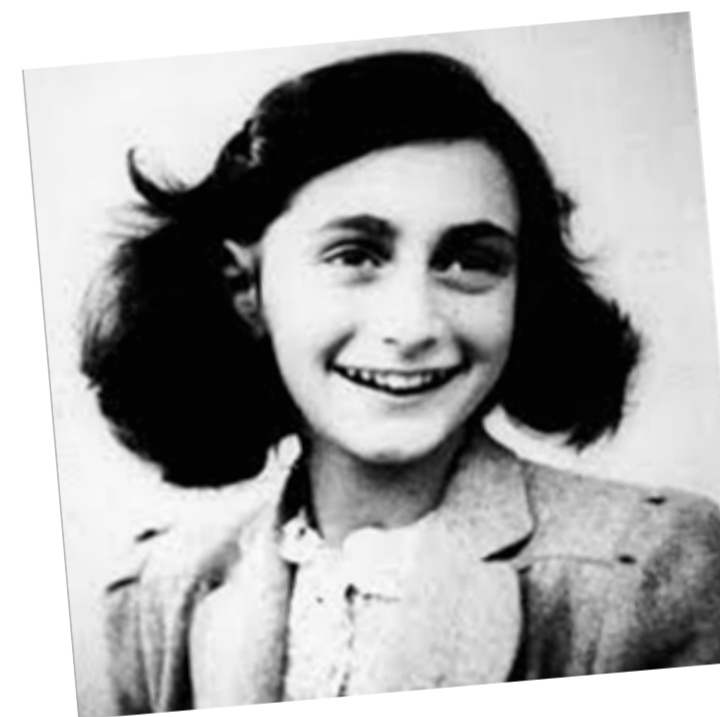
Ana Frank de niña

Su nombre real era Annelies Marie Frank Hollander, nació el 12 de junio de 1929 y murió en febrero de 1945 a los 15 años. Fue una niña judía alemana que con su diario conmovió al mundo.