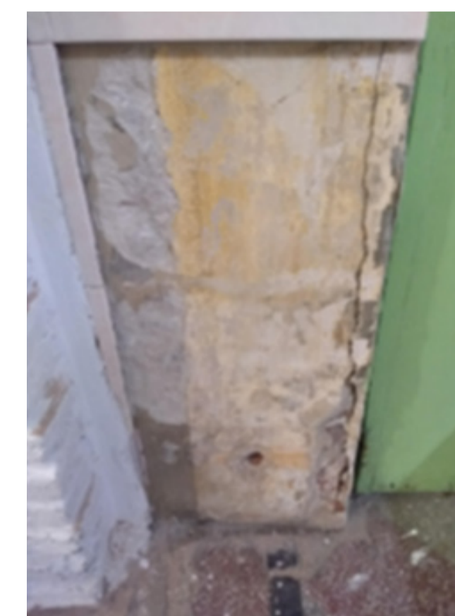
Pared rota - EII 1

1) Las paredes, techo y piso se rompen, se quiebra, se sale la pintura y no se puede arreglar por la falta de dinero.