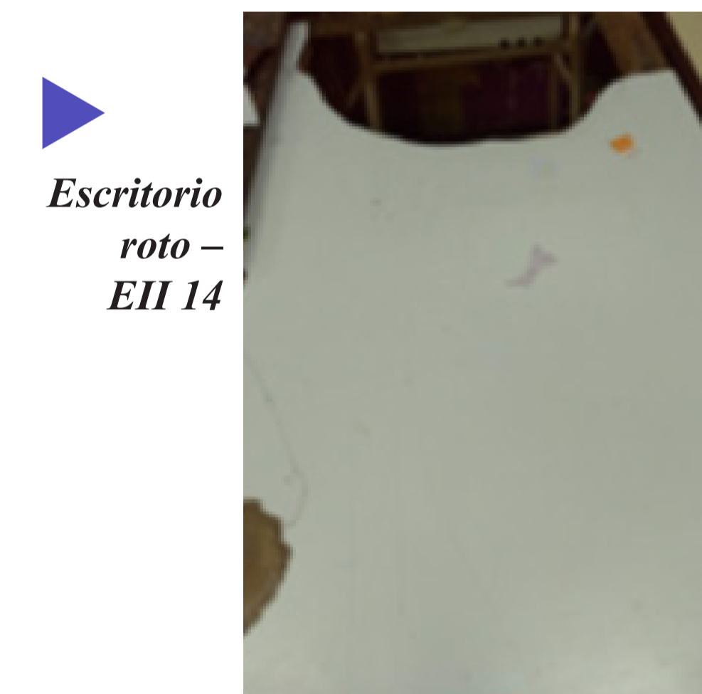
Escritorio roto - EII 14

2) Las filtraciones de agua son cuando el agua entra por el techo cuando hay lluvia y moja el piso que impide por ejemplo hacer educación física o actos.