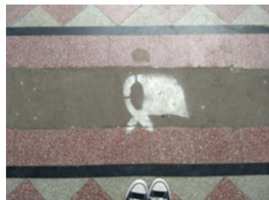
El patio de escuela EII 14