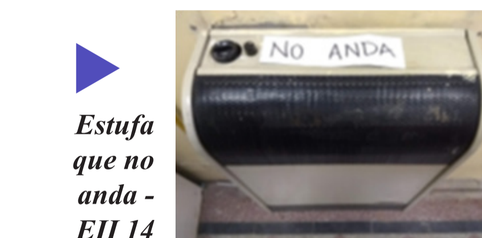
Estufa que no anda - EII 14

La falta de recursos en las escuelas hace que la calidad de educación sea más baja, porque así no podemos aprender tanto y los maestros no pueden enseñar, porque estamos preocupados en otras cosas.