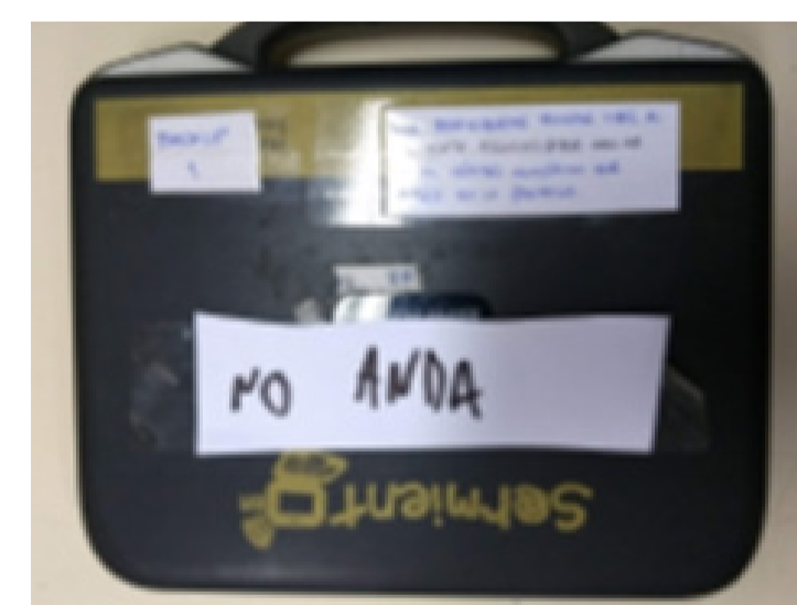
Computador que no andan - EII 14

3) Falta de gas, agua y luz. Las bajas temperaturas invernales y la falta de gas. Los alumnos y los docentes sufren de frío. Hay muchas escuelas donde se corta el agua o la luz.