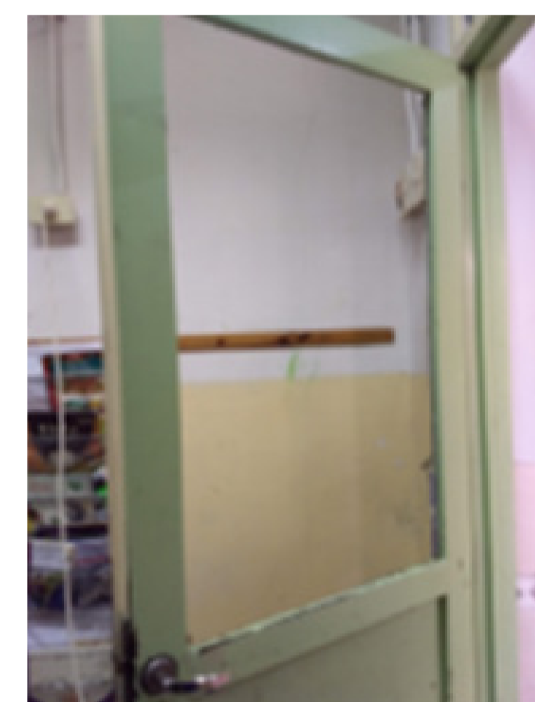
Puerta sin vidrio - EII14