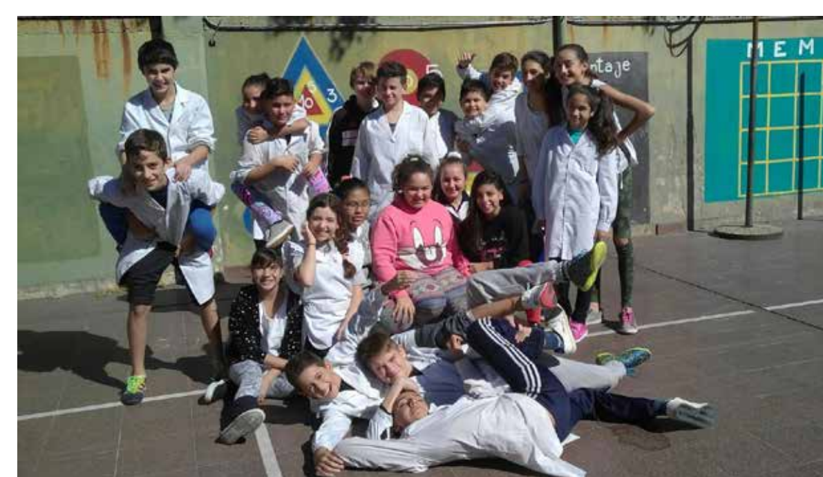
Alumnos de 7° A