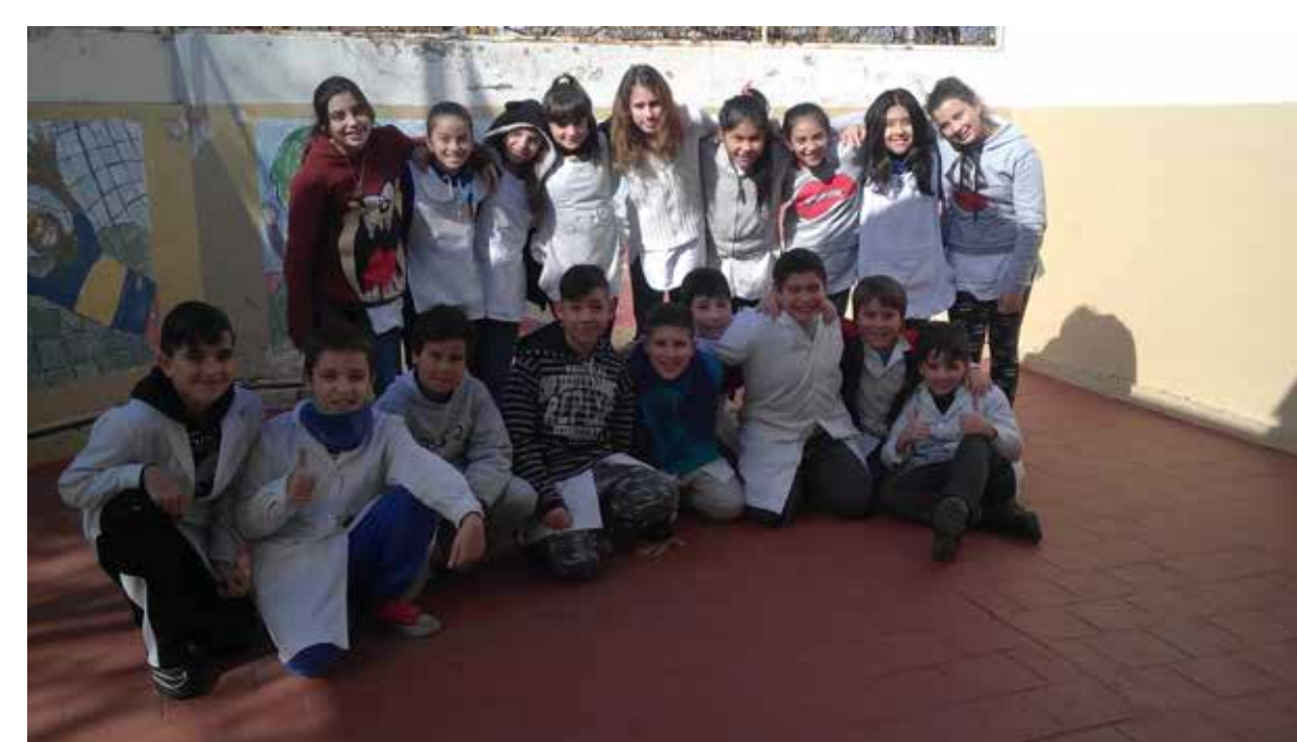
Alumnos de 6° A