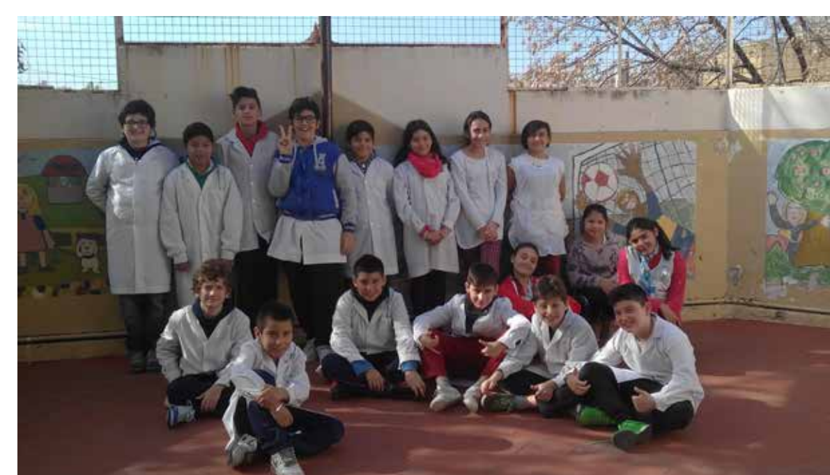
Alumnos de 6° B