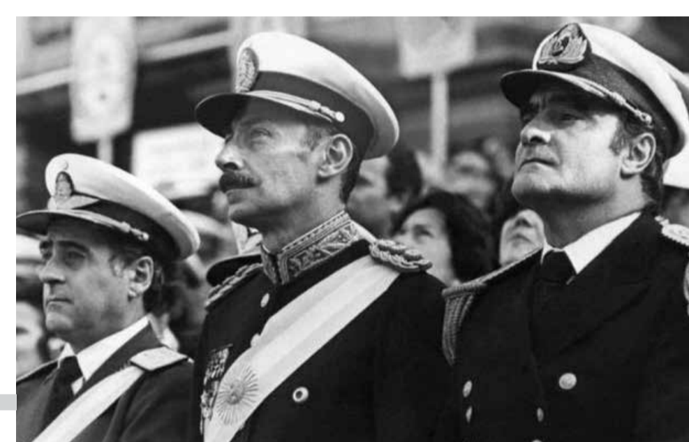
Videla, Massera y Agosti. Los tres comandantes en jefe que tomaron a la fuerza el gobierno en el '76.