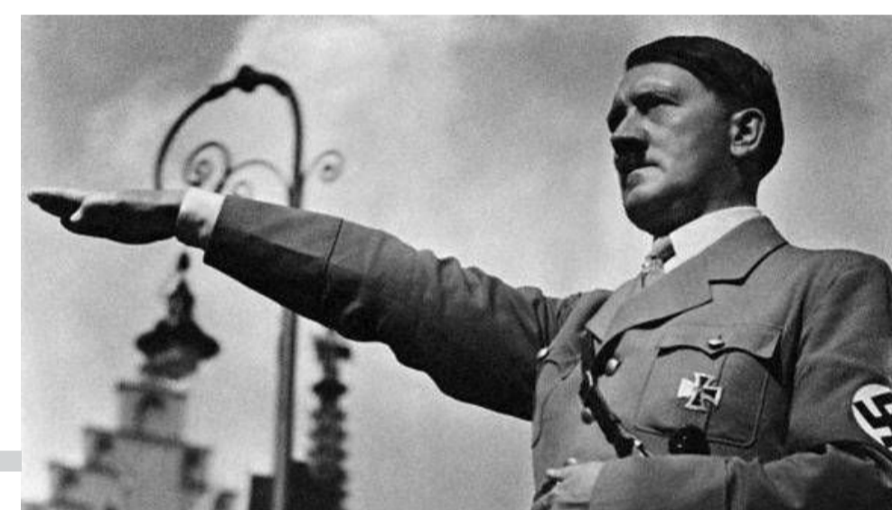
Adolf Hitler, el Führer.

En la Argentina, en su última dictadura cívico-militar, y en el Holocausto sucedieron acontecimientos muy similares. En Argentina, persiguieron a aquellos que pensaban diferente, por esto también se realizaron distintos actos como la quema de libros en Córdoba, acto que también sucedió en Berlín. Se secuestraba a estos que pensaban diferente y se los llevaba a centros clandestinos de detención donde se los torturaba y casi siempre los asesinaban. En Alemania y en algunos lugares de Europa en la Segunda Guerra Mundial se crearon campos de concentración y exterminio que cumplían las mismas funciones que los centros clandestinos en el '76 en Argentina. En conclusión, los militares del '76 y los nazis tenían pensamientos y formas de torturar parecidas.