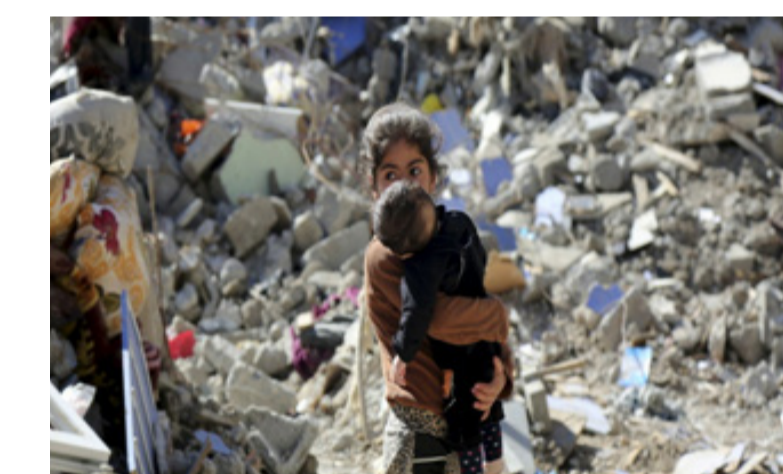
Niños escapando de las fuerzas armadas

Actualmente casi todos los países del mundo han reconocido la Declaración Universal de los Derechos Humanos. Pero aun así los derechos no se respetan en todas partes. En muchos países las personas no pueden expresarse con libertad, ni practicar su religión, ni tener un juicio justo, ni confiar en su seguridad personal, ni disfrutar de un trato igualitario. Quienes mayormente son víctimas de graves violaciones de los derechos humanos son las mujeres, los niños y las personas indefensas.