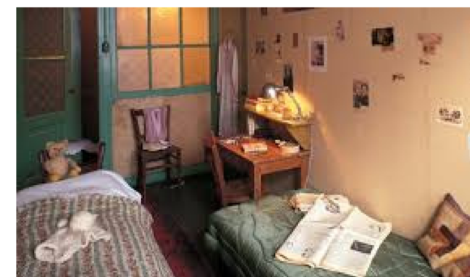
Refugio de Ana Frank y su familia en medio de la persecución nazi.

Miep Gies le entrega el “Diario de Ana Frank” a Otto, el cual sintió que debía seguir el deseo de ella y publicarlo. Así es como dicho libro llega hasta nuestros días.