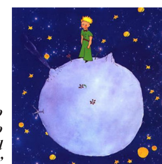
Dibujo extraído de "El principito"