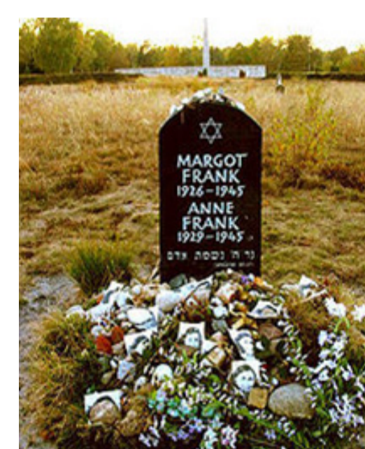
Lápida de Ana y Margot Frank, en Bergen-Belsen

DESPUES DE VER LA PELICULA "ANA FRANK" NOS INTRIGA SU NACIMIENTO, ARRESTO Y MUERTE.