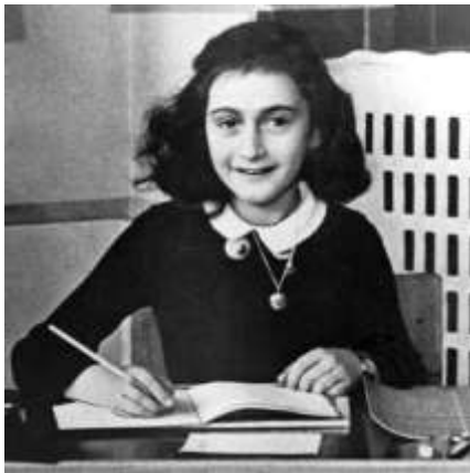
Ana Frank a la edad de 12 años

Ana Frank murió en el año 1942 de tifus, en el campo de concentración de Bergen-Belsen en Alemania.