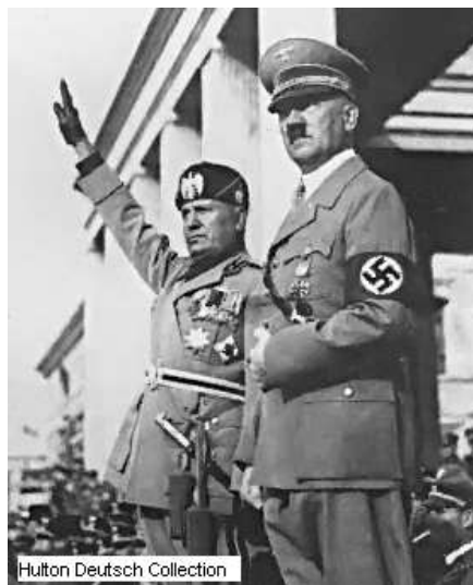
Adolf Hitler junto a Benito Mussolini.

El nazismo protagonizó unos hechos históricos que marcaron a Alemania siendo este un régimen sanguinario y horroroso de la historia del siglo XX.