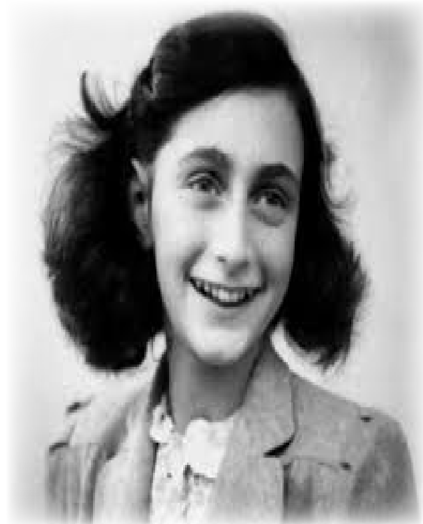
ANA FRANK EN SU NIÑEZ

La vida de Ana Frank fue muy dura, ella pasó por mucho en su corta vida.