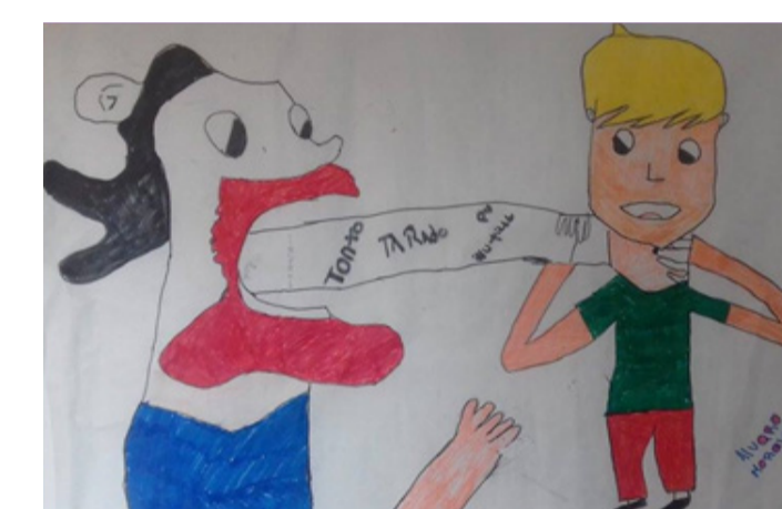
El agresor busca hacerte sentir culpable.

veces a lo largo del tiempo, de un comportamiento agresivo que le causa intencionalmente lesiones o malestar por medio del contacto físico, las agresiones verbales, las peleas o la manipulación psicológica.