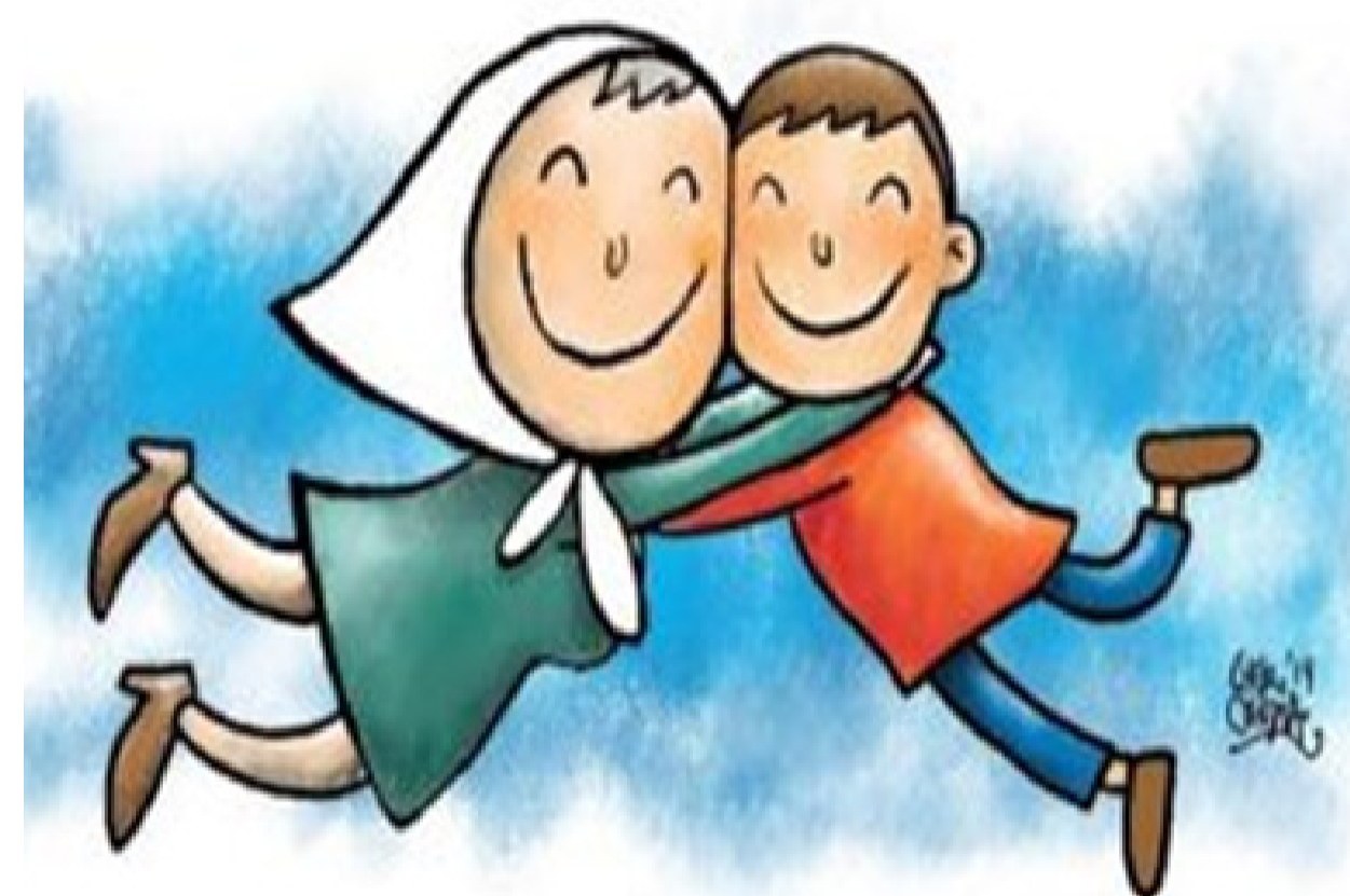
Abuelas de plaza de mayo encontraron al nieto 122.

Durante el cautiverio, el embarazo de Iris llegó a término; fue llevada a la ex Esma para dar a luz. Parió un varón y fue separada de él. El bebé fue uno de los 400 niños y niñas apropiados durante la última dictadura y buscados por Abuelas de Plaza de Mayo hasta hace algunos días. Sus padres aún permanecen desaparecidos.