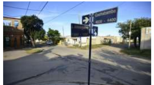
YOFRE SUR. EL LUGAR DEL CRIMEN.

El hecho ocurrió este sábado a las 22 hs en barrio Yofre Sur.