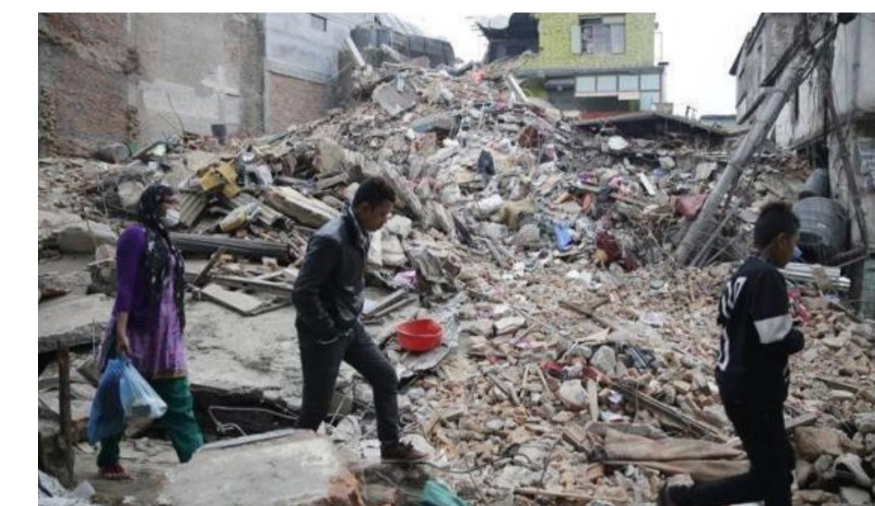
La imagen desoladora del terrible terremoto.

Un nuevo terremoto se ha producido al noreste de Nepal, cerca de la frontera con China. Según las últimas informaciones, la intensidad habría sido de 7,4 grados. El ministro de Exteriores, José Manuel García-Margallo, ha informado que los españoles que aún se encuentran en Nepal están localizados, por lo que “no tenemos ningún disgusto”.