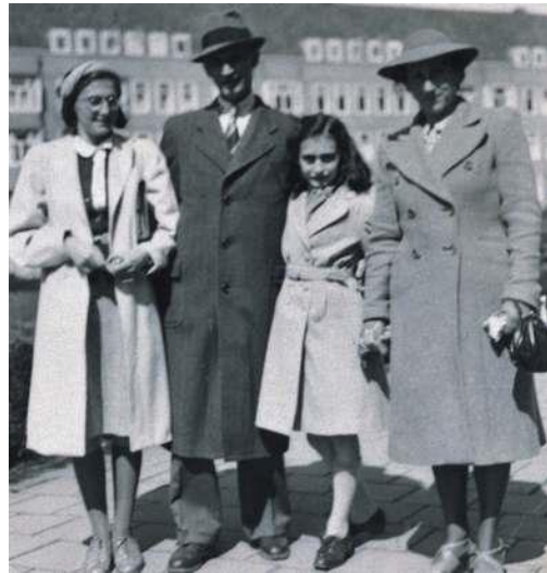
De izq a der: Margot, Otto, Ana y Edith

El 12 de Junio 1929 llega una nueva compañera de juego para Margot: ese día nace su hermana Ana, llamada oficialmente Annelies Marie.