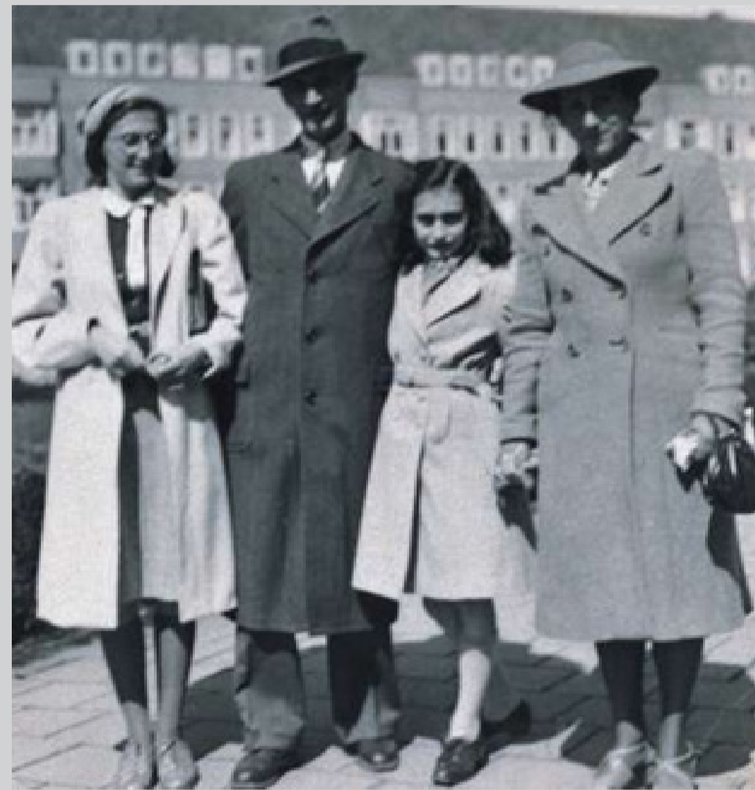
De izq a der: Margot, Otto, Ana y Edith

El 12 de Junio 1929 llega una nueva compañera de juego para Margot: ese día nace su hermana Ana, llamada oficialmente Annelies Marie.