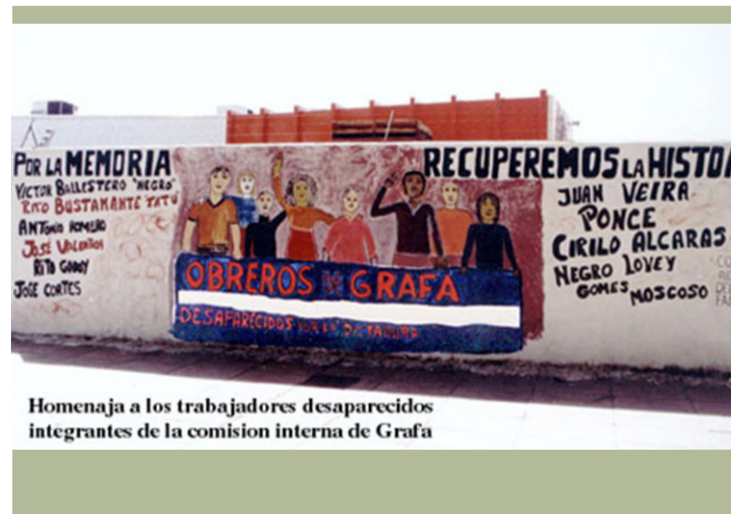
Homenaje a los trabajadores desaparecidos integrantes de la comisión interna de Graña

Así es como le agradecemos la ayuda y colaboración dada. Muchas gracias.